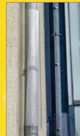
Kletterschutz (patentrechtlich geschützt)